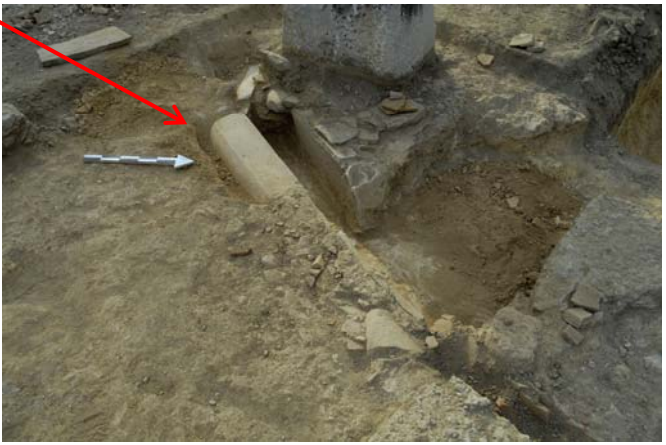
Sextus Eudamon Onasikrates, IG V 1 559